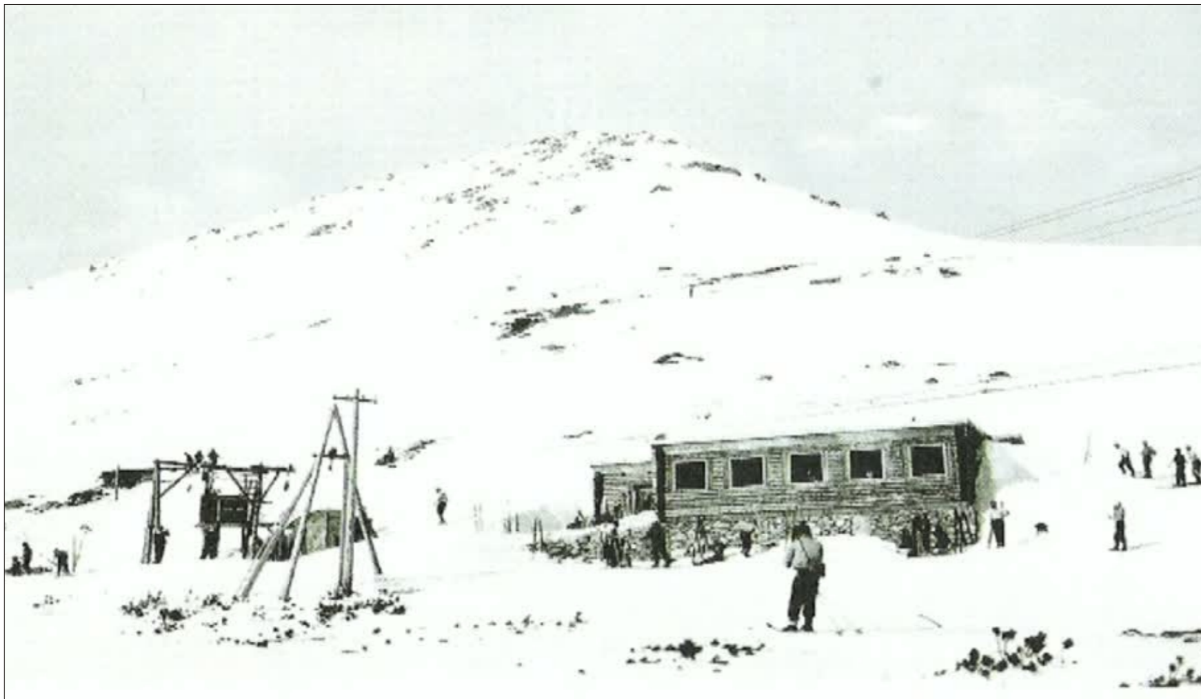
Pohľad na vrcholovú stanicu prvého lyžiarskeho vleku na Prednom Solisku a Chaty pod Soliskom