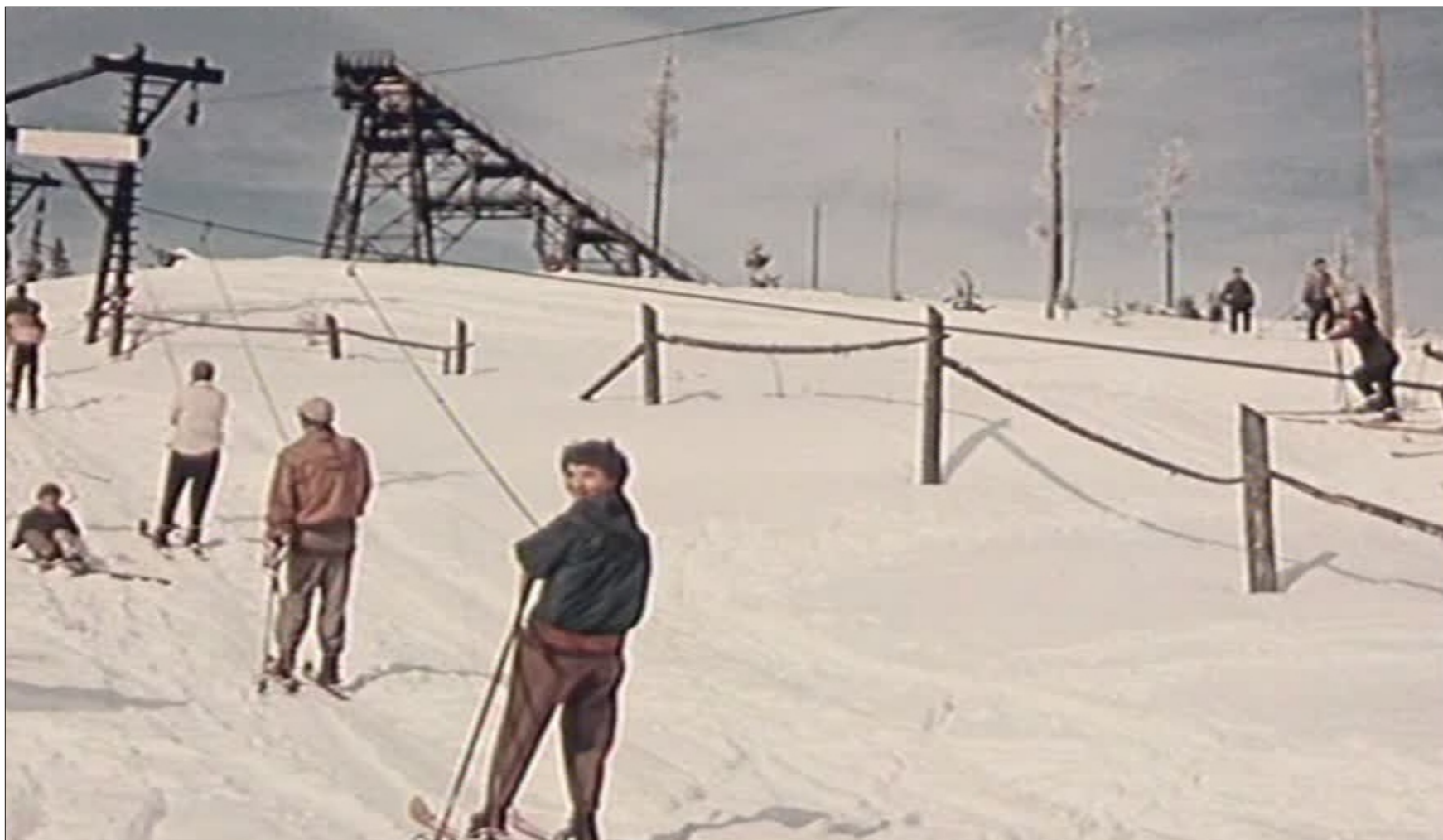
Záber z filmu "Anděl na horách" (1955)