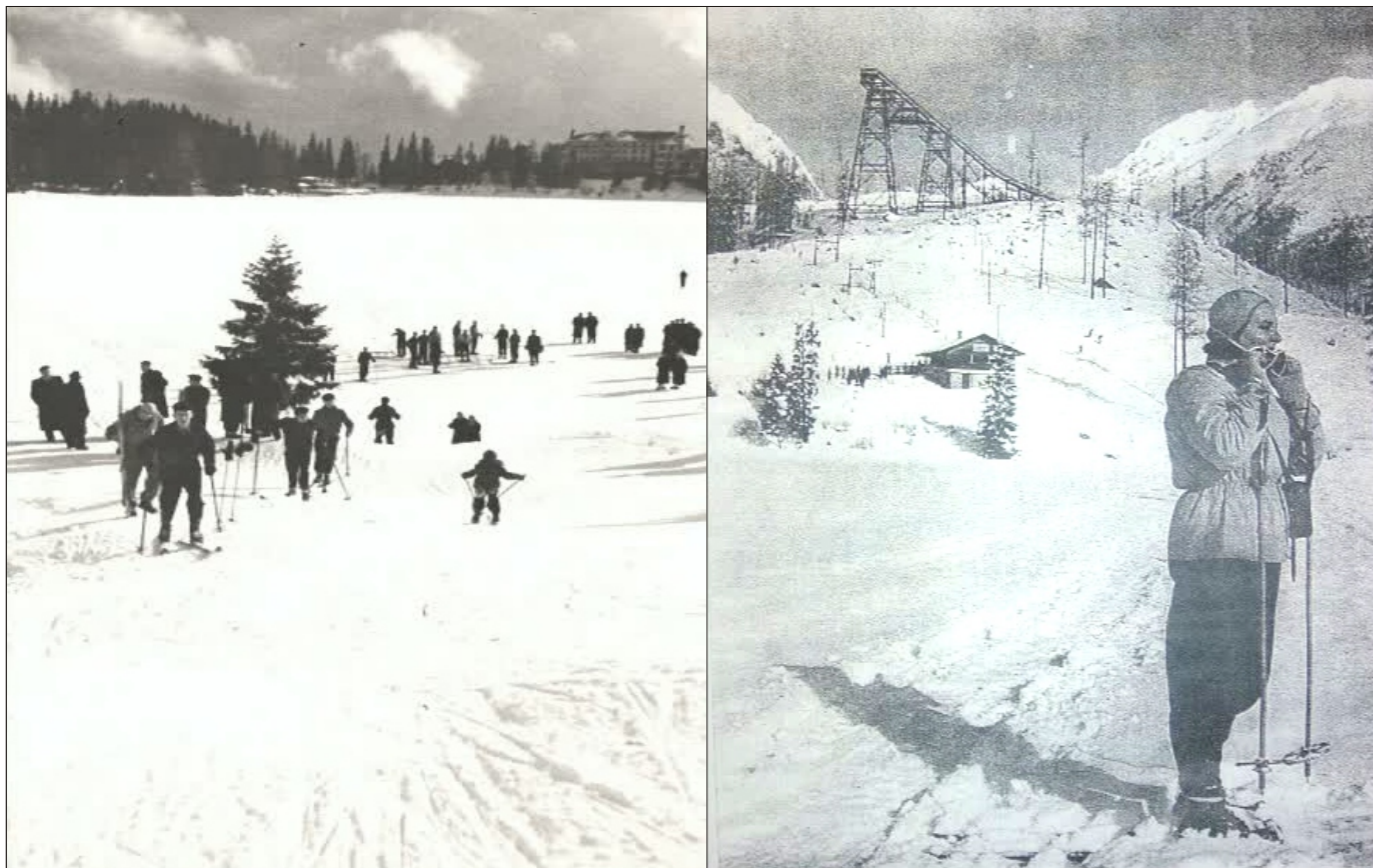
Lyžiari na pôvodnej zjazdovke nad Štrbským plesom