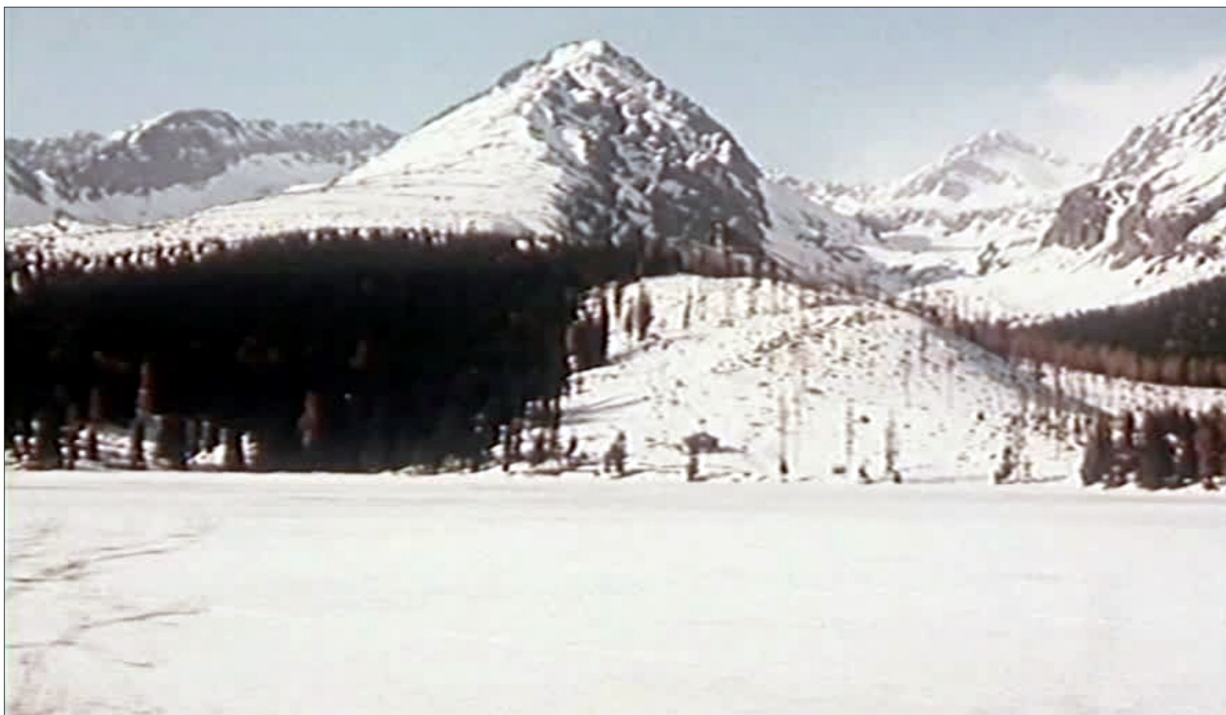
Pohľad na pôvodnú zjazdovku nad Štrbským plesom

Lýžiarska zjazdovka (p.č. 974/10) v dĺžke viac ako 3000 m. Viedla od severného brehu Štrbského plesa na úpätie Predného Soliska do výšky 1840 m n.m. Bola postavená v roku 1943.