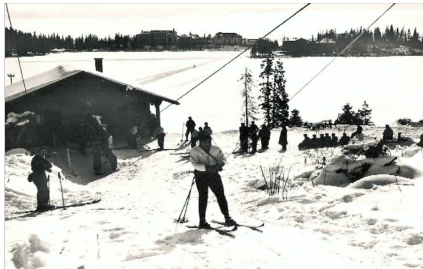
Pohľad na pôvodnú údolnú stanicu vleku nad Štrbským plesom - zimný a letný záber