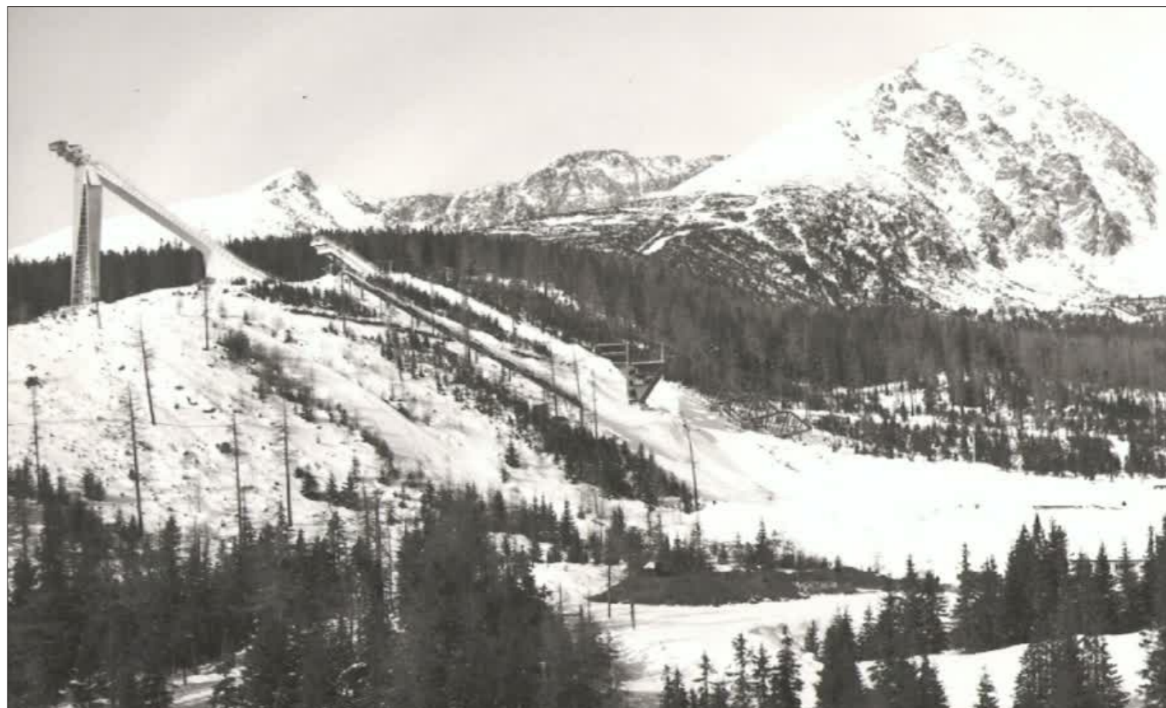
Areál FIS vybudovaný pri príležitosti organizovania Majstrovstiev sveta v severskom lyžovaní v roku 1970