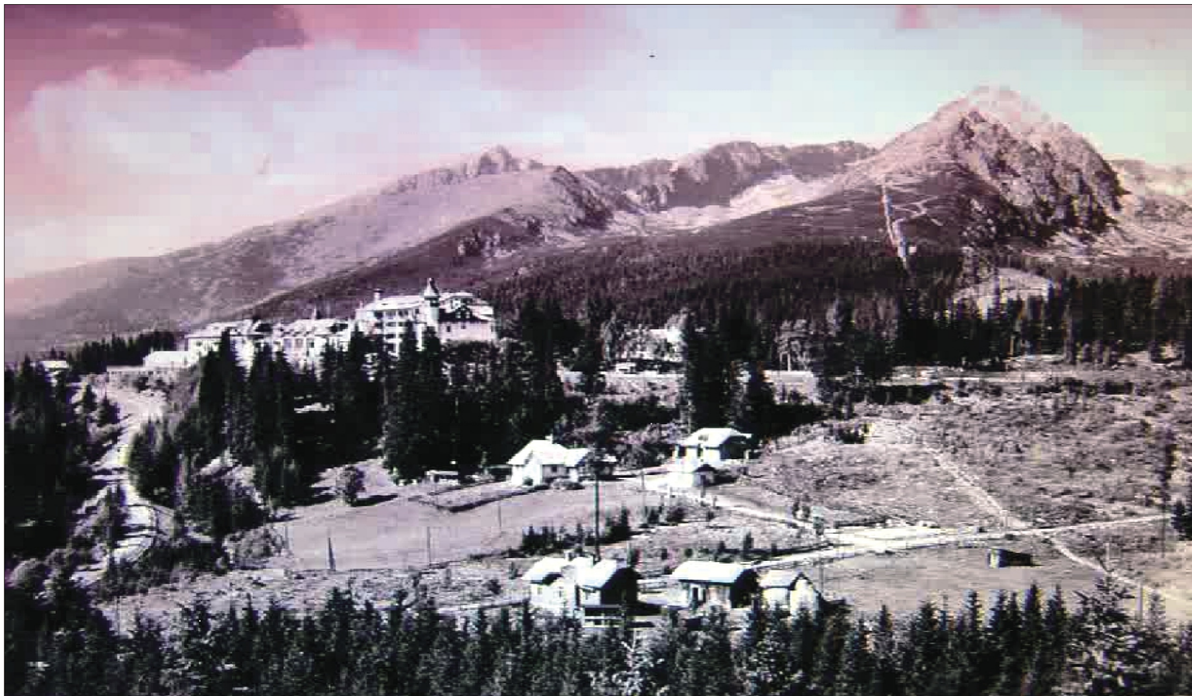
Pohľad na Predné Solisko