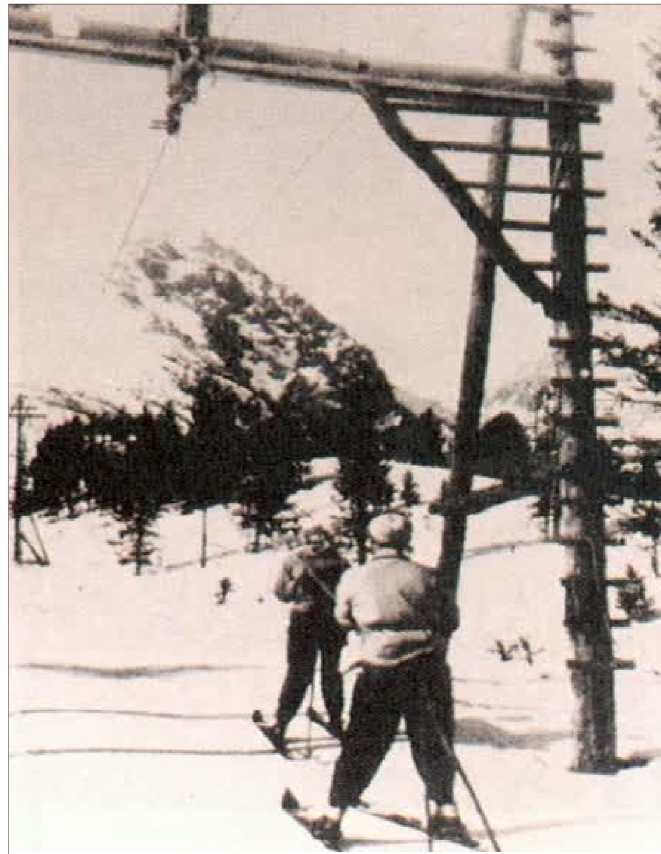
Prvý lyžiarsky vlek na Solisko pozostával z 38 drevených podpier. Bol zhotovený švajčiarskou technológiou, ktorý spĺňal najprísnejšie kritériá lyžiarskych vlekov v tej dobe v Európe. Mal malú prepravnú kapacitu.